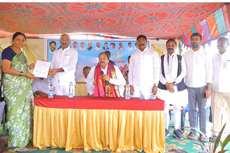
నగరంలోనే అత్యంత విలువైన ప్రాంతంగా రఘునాథం అలంకారం అభివృద్ధి రైల్వే మూడవ లైన్ నిర్మాణానికి భూముల లోల్పియిన వారికి రఘునాథం పాలెం మండలం వెంకటాయపాలెంలో ఇళ్ల పట్టణాలను అందించిన మంత్రి తుమ్మల

రాష్ట్ర వ్యవసాయ, శాఖ మంత్రి తుమ్మల నాగేశ్వర రావు కాలనీలో అవసరమైన మౌళిక వసతుల కల్పనకు కృషి