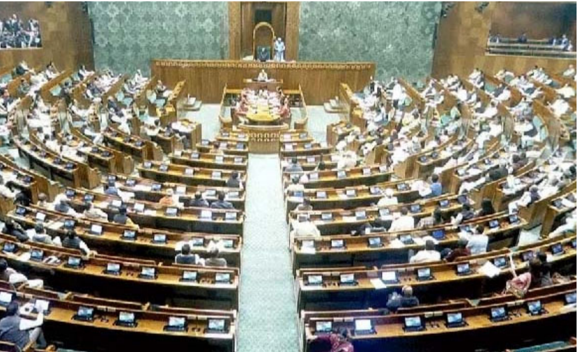
దూటి ఆరోపించారు. ఇండియాను నిర్వీర్యం చేసేందుకు సోరస్, కాంగ్రెస్ కలిసి పనిచేస్తోందని విమర్శించారు. దీంతో కాంగ్రెస్ సభ్యులు వెల్ లోకి దూసుకెళ్లారు. బీజేపీకి వ్యతిరేకంగా నినాదాలు చేశారు. తొలుత ఒంటి గంట, ఆ తర్వాత రెండు గంటల వరకు సభను వాయిదావేశారు.