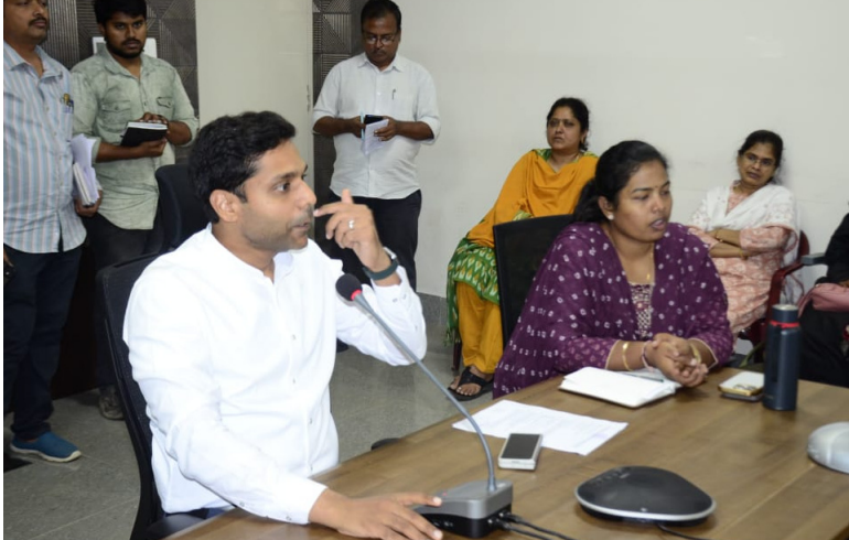
పరిషత్ ఉన్నత పాఠశాల

ఖమ్మం విద్యార్థులకు ఆంగ్ల పరిజ్ఞానం దశల వారీగా పెరిగేలా చర్యలు తీసుకోవాలని జిల్లా కలెక్టర్ ముజమ్మిల్ ఖాన్ అన్నారు. బుధవారం నాడు తెలంగాణ ఎడ్యుకేషన్ లిడర్షిప్ కలెక్టివ్ ప్రతినిధులు ఖమ్మం జిల్లాలో వి కెన్ లెర్న్ కార్యక్రమం అమలువుతున్న మామిళ్ళగూడెం లోని ప్రభుత్వ ఉన్నత పాఠశాల, జిల్లా పరిషత్ ఉన్నత పాఠశాల కొడీజర్ల, జిల్లా