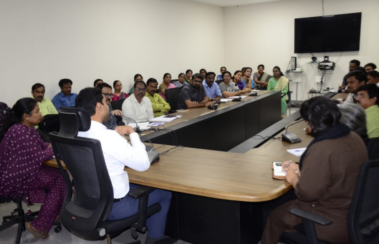
ఆంగ్లంలో మాట్లాడేందుకు విద్యార్థుల్లో