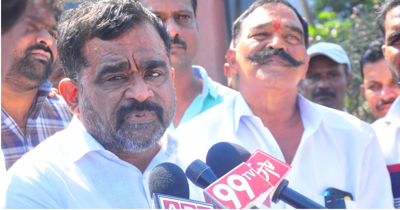
ఖమ్మం తెలంగాణ సమాజం

ఖమ్మం జిల్లాలో ఎన్టీఆర్ అభిమానులు నిరసన కార్యక్రమం