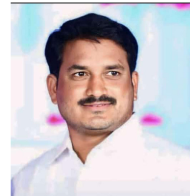
కావున ఇప్పటికైనా పార్టీలు గ్రహించి డాక్టర్ బాబాసాహెబ్ అంబేద్కర్ గారి యొక్క రాజ్యాంగానికి లోబడి పాలన చేయాలని, ప్రతి ఒక్కరూ రాజ్యాంగభద్రంగా వారి హక్కుల కోసం వారి విధుల కోసం రాజ్యాంగాన్ని మాత్రమే ప్రామాణికంగా చేసుకొని జీవించాలని తెలియజేస్తున్నాం

అదేవిధంగా నేడు భారతదేశంలో ఉన్నటువంటి ప్రతి సమస్యకు పరిష్కారం మార్గం రాజ్యాంగం మాత్రమే అన్న అంశం మీకు తెలవదా, గతవేల సంవత్సరాల నుండి దేవుడి పేరుతో మన ధర్మ శాస్త్రం ప్రకారం కొన్ని సామాజిక వర్గాలను గుడికి బడికి దూరంగా చేసినటువంటి సమాజం నుండి అందరూ చదువుకోవాలి అందరూ సందగా అందరూ చదువుకున్నప్పుడే ఈ దేశం అభివృద్ధి చెందు ఉందని విద్వంస డ్రీ, పురుషులు సమానంగా ప్రతి ఒక్కరికి అందించేందుకు కృషి చేసినటువంటి మహానీయులు మహాత్మా జ్యోతిబాపూలే అంబేద్కర్, ఈ మహానీయుల ఆదుగుజాడలలో ప్రతి ఒక్కరు విద్యను అభ్యసించారు అనే అంశం ఇప్పటికీ ఈ సమాజం గుర్తుంటుంది. డాక్టర్ బాబాసాహెబ్ అంబేద్కర్ దేవుడు అనేది నమ్మకం రాజ్యాంగం అనేది సైన్స్ గా, అదేవిధంగా దేవుడితో రాజకీయం చేయొద్దని ఆరోజే డాక్టర్ బాబాసాహెబ్ అంబేద్కర్ స్పష్టంగా చెప్పడం జరిగింది.