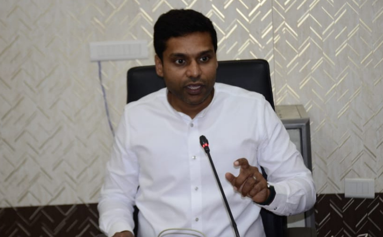
ఖమ్మం తెలంగాణ సమాజం