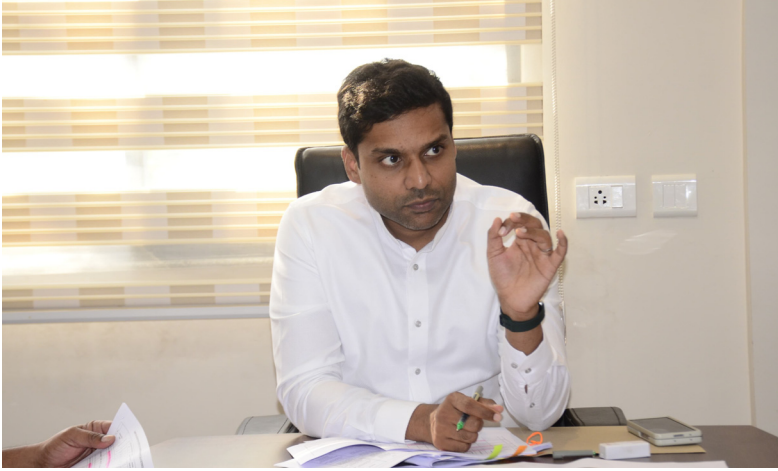
ఖమ్మం, తెలంగాణ సమాజంలో బ్యూరో

శాఖలు సమన్వయం తో సమస్యలు పరిష్కరించాలి వివిధ ప్రాజెక్టుల భూసేకరణ పై అధికారులతో సమీక్ష నిర్వహించిన జిల్లా కలెక్టర్