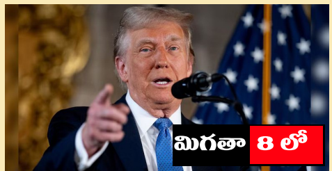
మిగతా 8 లో

కాటోయే అమెరికా అధ్యక్షుడు డొనాల్డ్ ట్రంప్ పాలన ఎలా ఉండబోతోందో ఇప్పటికే ఒక అంచనా ఏర్పడింది. ఆయనలో బెదిలింపు దోరణి ఎక్కువగా కనిపిస్తోంది. అగ్రరాజ్య అధినేత అనే అహంకారం అది. తమ ఉత్పత్తులను దిగుమతి చేసుకోనే ఏ దేశమైనా వాటి మీద పన్నులు విధిస్తే తాము కూడా దెబ్బకు దెబ్బతీస్తామని అలాంటి దేశాలలో భారత్ కూడా ఉందని ట్రంప్ ఓపెన్ గా చెప్పాడు. తొలిసారి అధికారానికి వచ్చినప్పుడు చైనాపై వాణిజ్యపోరును ప్రారంభించటమే కాదు, మన దేశం నుంచి చేసుకోనే దిగుమతులపై ప్రాధాన్యత వ్యవస్థ విధానం(జిఎస్ టిఎల్) భాగంగా ఇప్పున్న రాయితీలను కూడా రద్దు చేసిన పెద్దపనివీ ట్రంప్. మనదేశాన్ని తమ వలలోకి లాక్కొనేందుకు అంతకు ముందు అమెరికా విసిరిన బిస్కెట్ వంటిది ఆ రాయితీ. ట్రంప్ చర్యకు ప్రతిగా మనం కూడా అమెరికా ఉత్పత్తులపై పన్ను విధింపుకు పూనుకున్నాం. వాటి మీద ప్రపంచ వాణిజ్య సంస్థలో పరస్పరం మూడేసి కేసులు దాఖలు చేశారు.