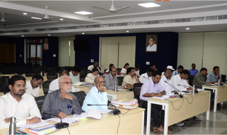
మండలంలోని పి.హెచ్.సి. గురుకులాలపాఠశాలలు, అంగన్వాడీ కేంద్రాలను ఆకస్మిక తనిఖీ చేయాలి ప్రభుత్వ భూములలో ప్రైవేట్ ల్యాండ్లకు వెంటనే ఫిస్కల్ వేయాలి సంక్రాంతి నాటికి ధరణి పెండింగ్ దరఖాస్తులు పరిష్కరించాలి రెవెన్యూ శాఖ పని తీరుపై సమీక్షించిన జిల్లా కలెక్టర్ ఖమ్మం తెలంగాణ సమాజం