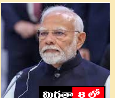
మిగతా 8 లో

హరియాణా, డిసెంబర్ 20(తెలంగాణ సమాజం) : ఇండియన్ నేషనల్ లోక్ దళ్ అధ్యక్షుడు, హరియాణా మాజీ ముఖ్యమంత్రి ఓం ప్రకాశ్ చౌతాలా (89) శుక్రవారం కన్నుమూశారు. గురువారం రాత్రి ఆయనకు గుండె పోటురాగా, ఆయనను వెంటనే ఆసుపత్రికి తరలించినప్పటికీ ఆయనను వైద్యులు రక్షించలేకపోయారని పార్టీ అధికార ప్రతినిధి తెలిపారు. మాజీ ఉపప్రధాని దేవీలాల్ కుమార్తెడైన ఓం ప్రకాశ్ చౌతాలా హరియాణాకు ఐదు సార్లు (1989 నుంచి 2005 వరకు) ముఖ్యమంత్రిగా పనిచేశారు.