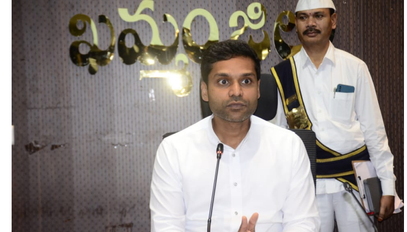
దరఖాస్తులు త్వరగా పరిష్కరించేందుకు ఎటువంటి వ్యూహం పాటించాలో ఒక ప్రణాళిక తయారు చేసుకోవాలని అన్నారు. ప్రతి తహసీల్దార్ తన దగ్గర ఉన్న పెండింగ్ దరఖాస్తులు ఎలా పరిష్కరించాలో ప్రణాళికను రెవెన్యూ డివిజన్ అధికారికి సమర్పించాలని, సంక్రాంతి వరకు ఎట్టి పరిస్థితుల్లో దరఖాస్తులు పరిష్కారం అవ్వాలని అన్నారు. 5. ఎకరాల కంటే తక్కువ ఉన్న ఆర్.ఎన్.ఆర్ దరఖాస్తులను డిసెంబర్ నెలలో, 10 ఎకరాల వరకు ఉన్న ఆర్.ఎన్.ఆర్ దరఖాస్తులు సంక్రాంతి వరకు పరిష్కరించాలని, 10 ఎకరాల కంటే ఎక్కువ ఉన్న దరఖాస్తులను సంక్రాంతి తర్వాత ప్రత్యేక డ్రైవ్ నిర్వహించి పరిష్కరించాలని కలెక్టర్ తెలిపారు. మండలంలో ప్రజావాణి కార్యక్రమానికి స్పందన రావడం లేదని, మండల స్థాయి సమస్యలకు జిల్లా వరకు దరఖాస్తులను రాకుండా చూసుకోవాలని బాధ్యత తహసీల్దార్లపై ఉంటుందని కలెక్టర్ తెలిపారు. మండల ప్రజావాణి వచ్చే దరఖాస్తుల డిస్కంజెట్ లో క్వాలిటీ పెంచాలని, మండల ప్రజావాణి కార్యక్రమంపై ప్రజలలో నమ్మకం పెంచాలని అన్నారు. మండలంలో పాలనపై తహసీల్దార్లు పట్టు సాధించాలని అన్నారు. మండల పరిధిలో ఉన్న రెసిడెన్షియల్ పాఠశాలలు, సంక్షేమ హాస్పిటల్, కస్తూర్బా గాంధీ బాలిక విద్యాలయాలు, మోడల్ స్కూల్స్ తనిఖీ చేస్తూ పిల్లలకు నాణ్యమైన ఆహారం అందేలా చూడాలని, ప్రాథమిక ఆరోగ్య కేంద్రాల పనితీరు పర్యవేక్షించాలని కలెక్టర్ తెలిపారు. మండలంలోని అంగన్వాడీ కేంద్రాలు, ప్రభుత్వ పాఠశాలలు తనిఖీ చేయాలని అన్నారు. రెసిడెన్షియల్ పాఠశాలల సందర్భంలో బియ్యం నాణ్యత, ఆహార సామాగ్రి భద్ర పరిచే స్టాల్ రూమ్ ను తప్పనిసరిగా పరిశీలించాలని, దుష్ప్రవృత్తి ఉన్నారూ, రోమల నుంచి రక్షణ తీసుకుంటున్న చర్యలు చేపట్టాలని, చిన్న చిన్న సమస్యలను అక్కడికక్కడే పరిష్కరించాలని అన్నారు. స్టాల్ బుకింగ్ సమయంలో రిజిస్ట్రేషన్ కోసం వచ్చే ప్రజలను అనవసరంగా అడ్డ

ఖమ్మం మండలంలో పాలనపై తహసీల్దార్లు పట్టు సాధించాలని జిల్లా కలెక్టర్ ముజమ్మిల్ ఖాన్ కలెక్టరేట్ లోని సమావేశ మందిరంలో రెవెన్యూ శాఖ పనితీరుపై అదనపు కలెక్టర్ పి. శ్రీనివాస్ రెడ్డి తో కలిసి సమీక్షించారు. ప్రభుత్వ భూముల ఆక్రమణల తొలగింపు, ధరణి, ప్రజావాణి దరఖాస్తులు, మీసెవా దరఖాస్తులు, కళ్యాణ లక్ష్మి, షాద్ మిజాబ్, ఓటర్ల జాబితా తయారీ, తదితర అంశాలపై కలెక్టర్ సుదీర్ఘంగా సమీక్షించారు. ఈ సందర్భంగా జిల్లా కలెక్టర్ మాట్లాడుతూ సంక్రాంతి లోపల ధరణిలో పెండింగ్ ఉన్న దరఖాస్తులను పరిష్కరించాలి అవసరం ఉందని అన్నారు. జిల్లాలో 4,400 ధరణి దరఖాస్తులు పెండింగ్ ఉంటే వీటిలో దాదాపు 2400 దరఖాస్తులు ఫిజికల్ ఫైల్ అందని కారణంగా పెండింగ్ ఉన్నాయని, వీటిని ఫూల్ చేసేందుకు సంబంధిత ఫైల్స్ వెంటనే రెవెన్యూ డివిజన్ అధికారి, అదనపు కలెక్టర్, కలెక్టర్ కార్యాలయాలకు అందించాలని కలెక్టర్ తెలిపారు. మండలాల్లో పెండింగ్ ఉన్న