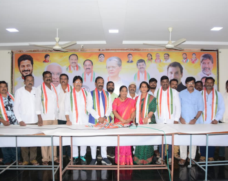
ఖమ్మం తెలంగాణ సమాజం బ్యూరో డిసెంబర్ 20

కాంగ్రెస్ పార్టీలో చేరిన 46వ డివిజన్ కార్పొరేటర్ కన్వెన్షన్ ప్రసన్న